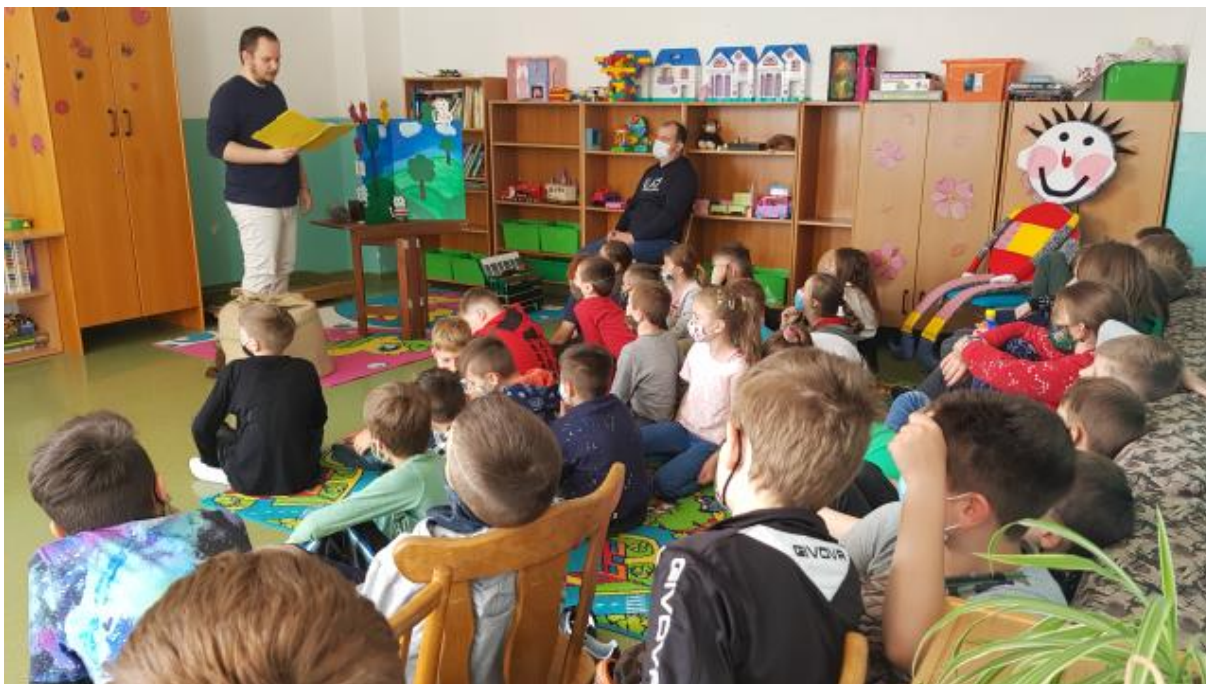
ZŠ kpt. Nálepku v Stupave