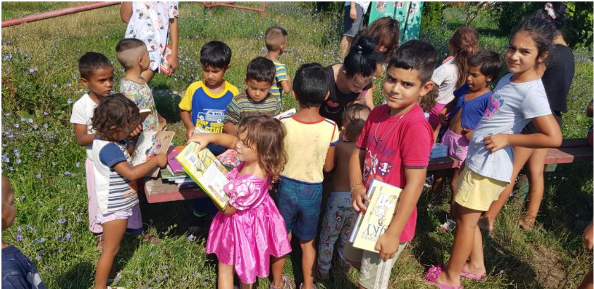
Komunitné centrum Lučenec