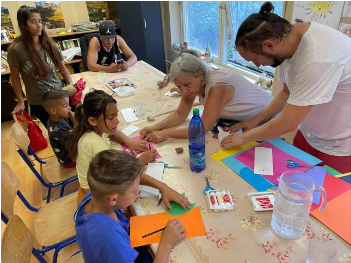
Komunitné centrum Poltár